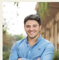
Victor Ranieri GM Italy